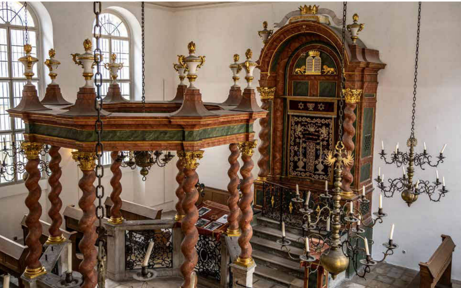
Synagoge in Ansbach