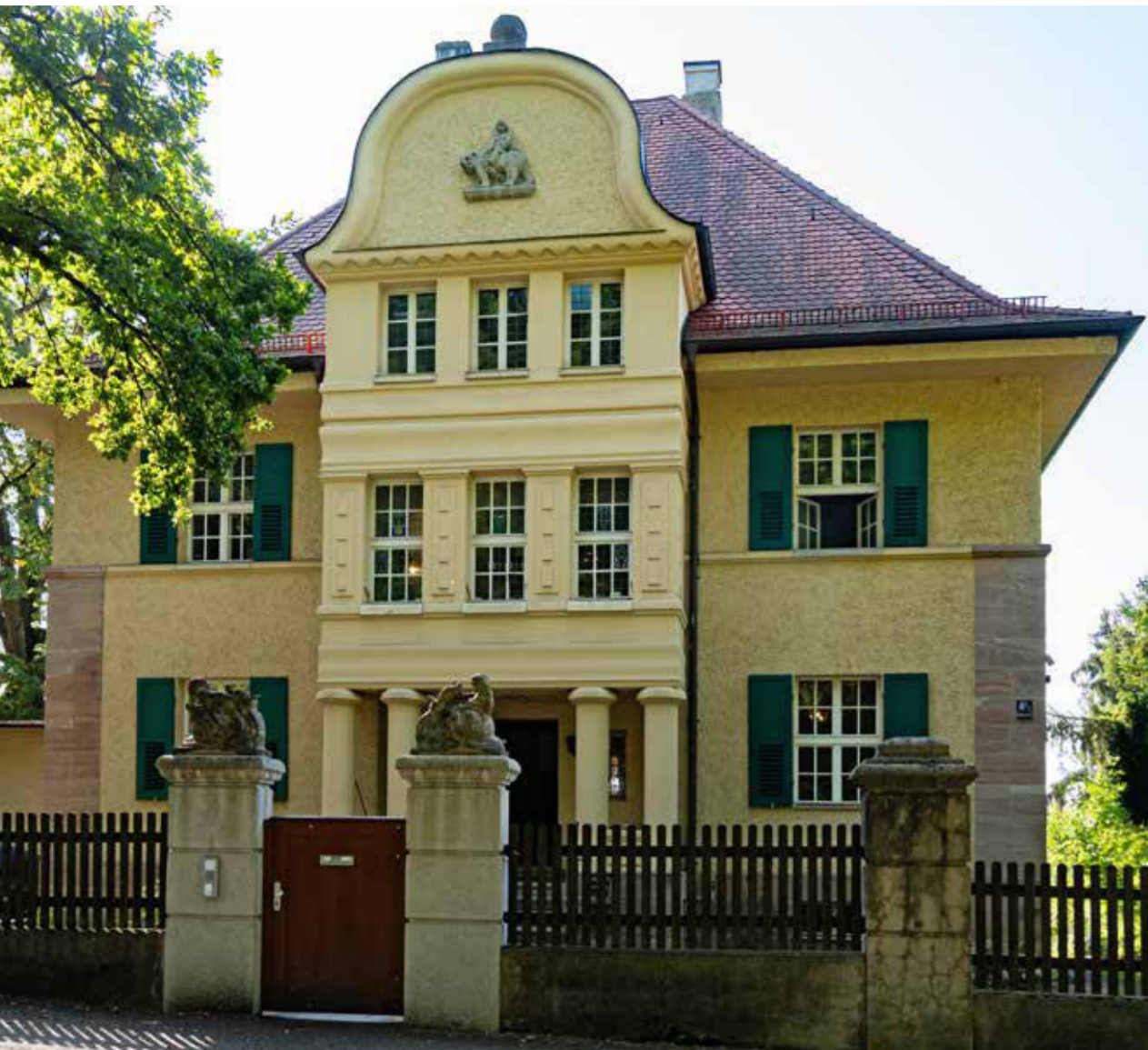
Synagoge in Erlangen