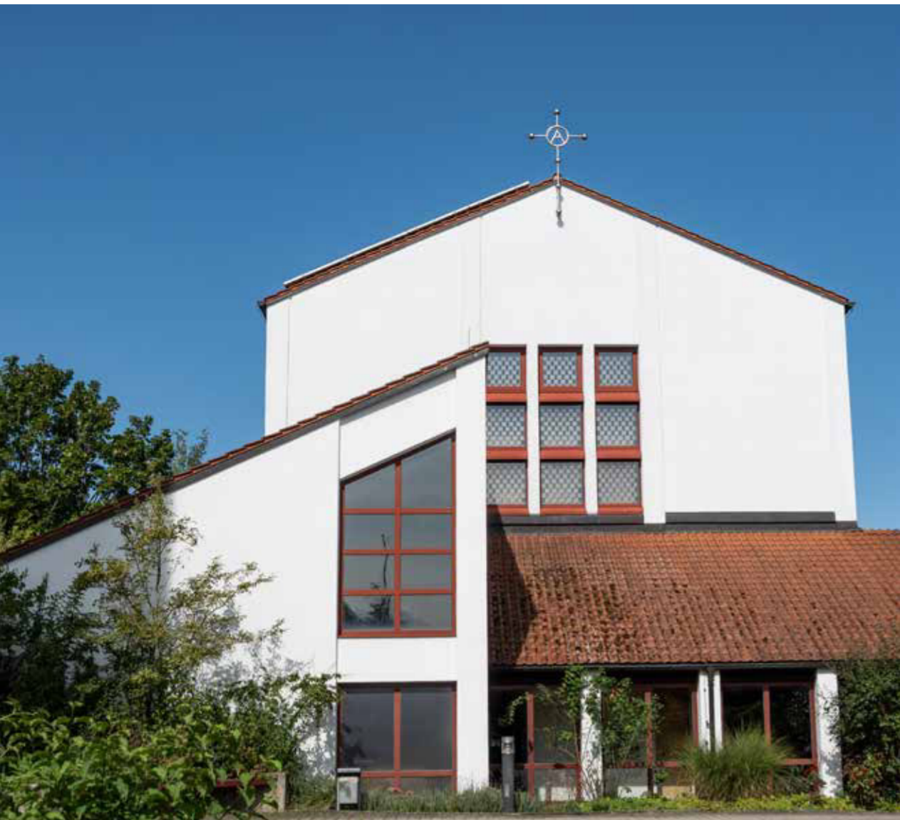
Sankt Urban in Bamberg