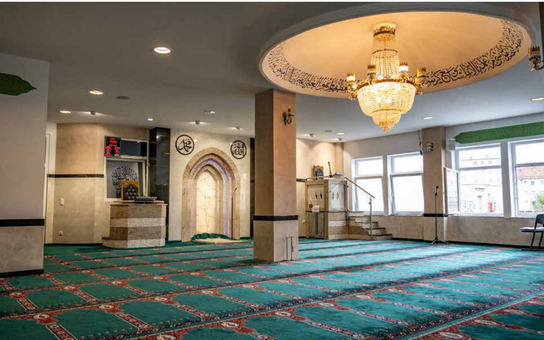
Albanische Moschee in Nürnberg